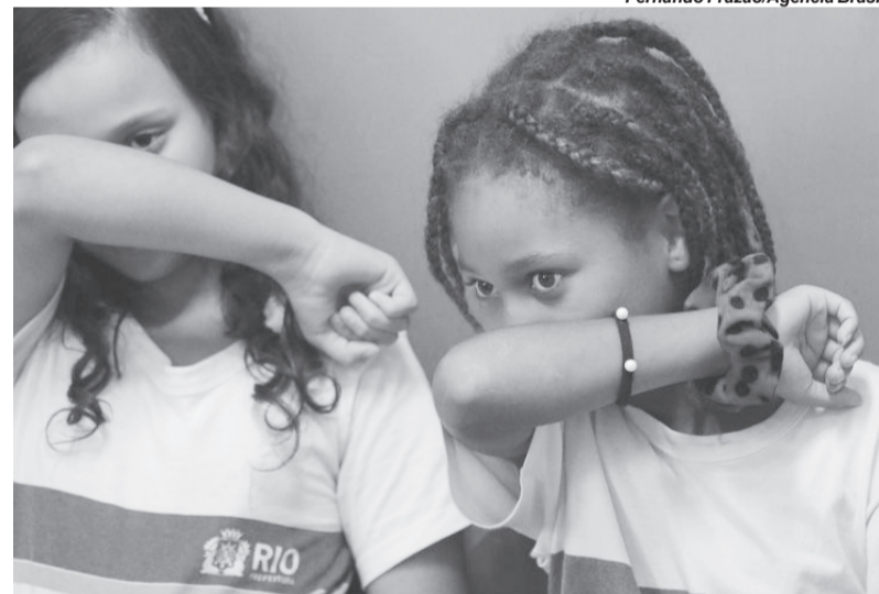
Alunos aprendem a prevenção ao novo coronavírus (Covid-19) na Escola Municipal Pedro Ernesto

lar das mãos. Não precisa ser uma conversa assustadora”. O Unicef ainda orienta a mostrar às crianças como cobrir o nariz e a boca com o cotovelo flexionado ao tossir ou espirrar e a explicar que é melhor não ficar muito perto das pessoas que apresentem esses sintomas.